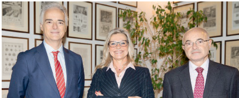
PALAZZO SORAGNA I relatori del convegno sulla Gdo spagnola.

■ Quarantasei milioni di potenziali consumatori e settantacinque milioni di turisti all'anno. Bastano pochi dati per dimostrare come la Spagna rappresenti uno dei mercati europei più attraenti. Il paese iberico infatti, si colloca al quattordicesimo posto nel ranking delle economie mondiali per volume di Pil e al quinto a livello europeo. Per approfondire le opportunità e le problematiche che le aziende alimentari italiane, soprattutto quelle di piccola e media dimensione, possono riscontrare nell'affrontare la vendita alla grande distribuzione spagnola, ieri mattina a Palazzo Soragna si è svolto l'incontro dal titolo «Industria alimentare e Grande Distribuzio-